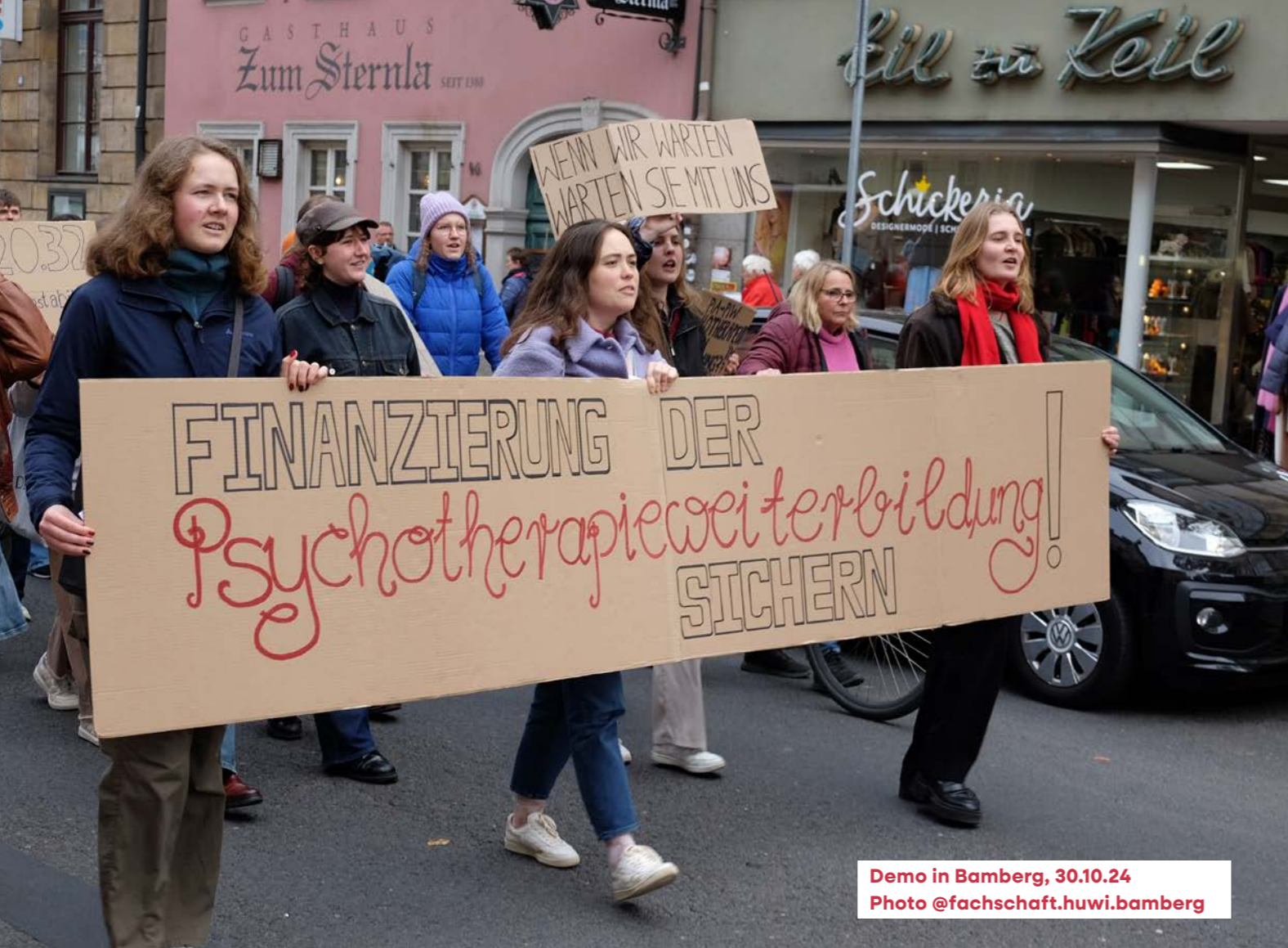
Demo in Bamberg, 30.10.24