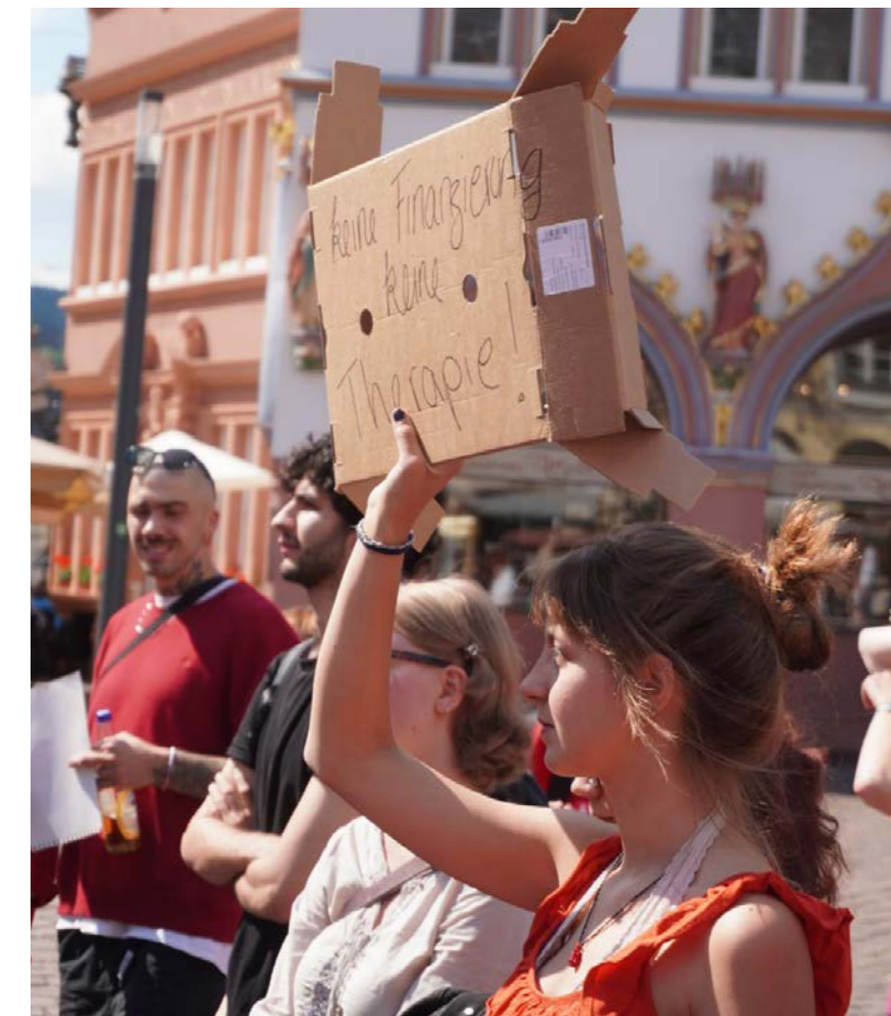
Demo in Trier, 24.06.24

Deutschlandweit gibt es daher aktuell nur eine zweistellige Anzahl an Weiterbildungsstellen. Dem gegenüber steht ein Zahl von mindestens 2.500 Studierenden, die jedes Jahr ihr Studium nach dem neuen System abschließen und auf einen Weiterbildungsplatz angewiesen sind ( BPtK, 2024b ). Diese Einzellösungen reichen nicht aus, um den Nachwuchsbedarf abzudecken und damit die Gefahren für die Versorgungssicherheit, für die Qualität der Behandlung und damit für die Gesundheit der Bevölkerung in Deutschland abzuwenden.