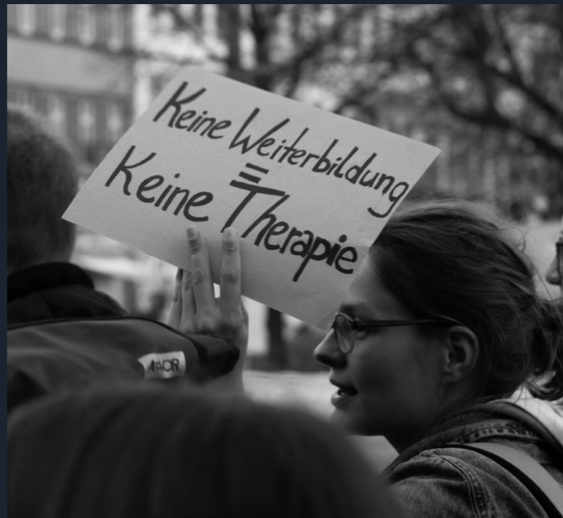
Demo in Hamburg, 28.10.24