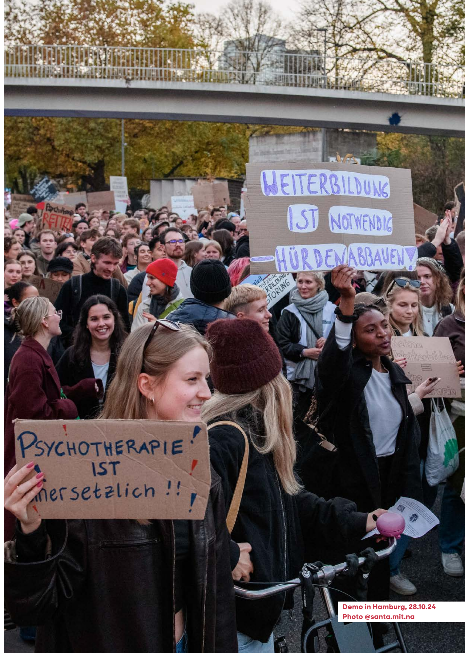
Demo in Hamburg, 28.10.24

Allerdings wurde die neue Verhandlungsmöglichkeit auf „Leistungen gegenüber Versicherten“ einschränkt. So besteht eine Finanzierungslücke für die Kosten von Theorie, Selbsterfahrung und Supervision fort, die kaum ausgeglichen werden kann. Ebenfalls sieht die Änderung keine Regelungen für die Weiterbildung in Kliniken, Praxen und MVZ vor, wo auch weiter dringender Handlungsbedarf besteht.